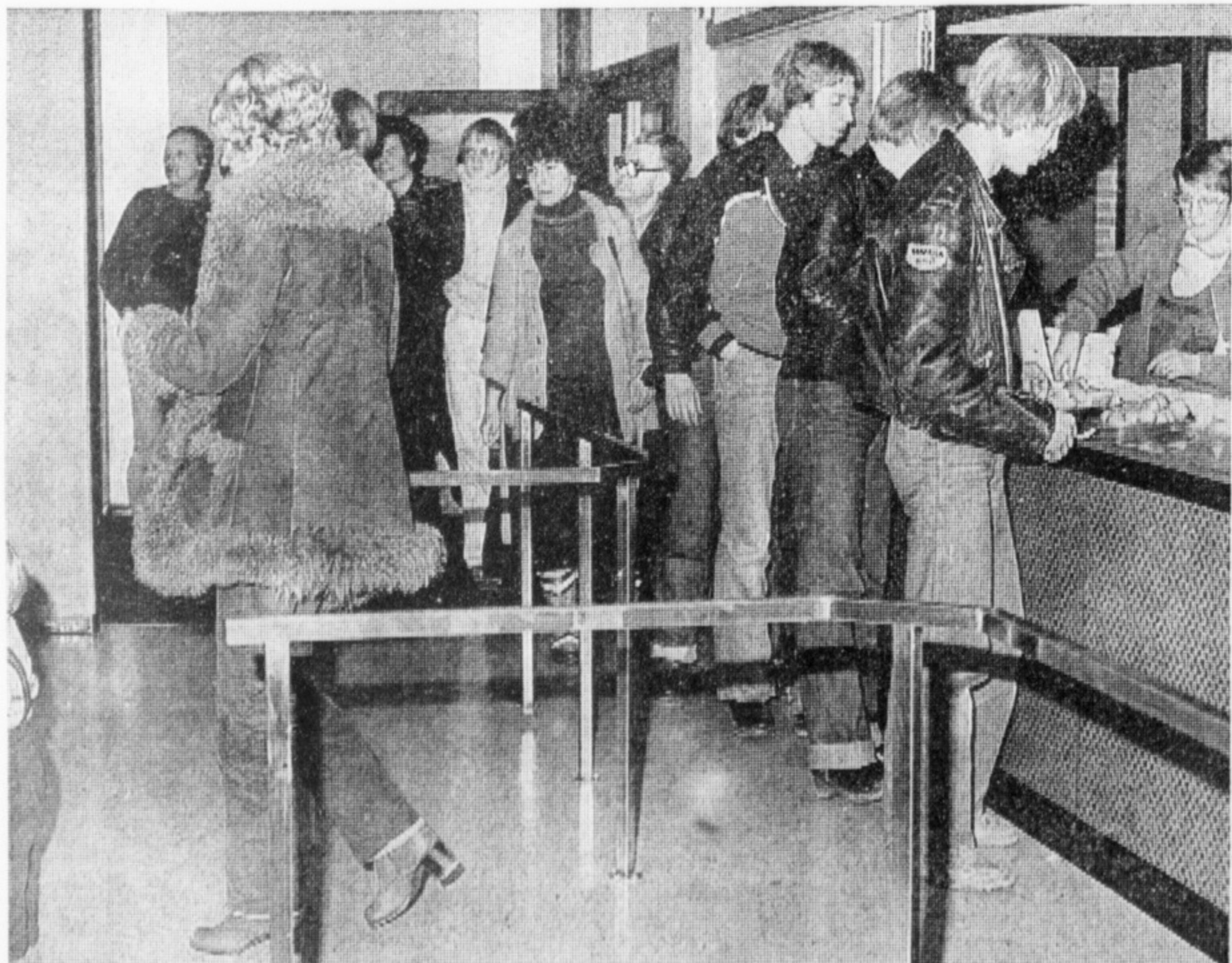
Gut versorgt wurden in der Apenrader Brundlundschule bis zu 200 in Not geratene Autofahrer während des Jahreswechsels, als Schneesturm die Straßen blockierte. Die Zivilverteidigung sorgte für Verpflegung, ärztliche Hilfe, sogar für Windeln bei Bedarf. Bis in Schleswig-Holstein die Straßen wieder passierbar sind, wird das Notlager noch aufrecht erhalten